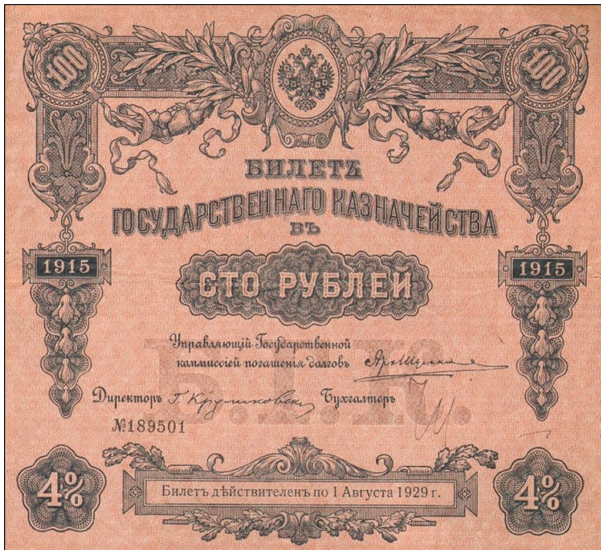
E4944 – Dluhopis Ruské carské státní pokladny na 100 rublů vydaný 1. srpna 1915 a splatný (teoreticky) až do roku 1929