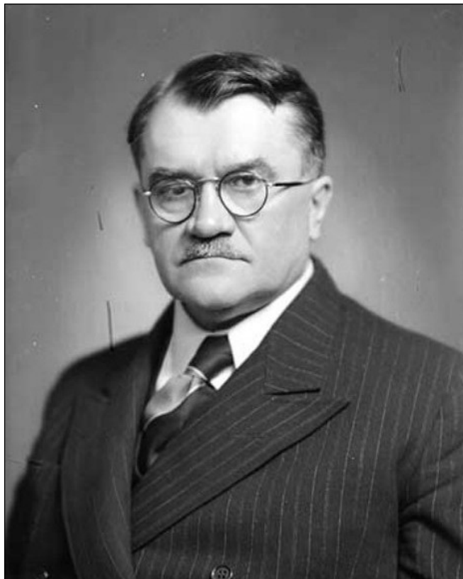
prof. JUDr. Karel Engliš (*17. srpna 1880 Hrabyně - † 13. června 1961)